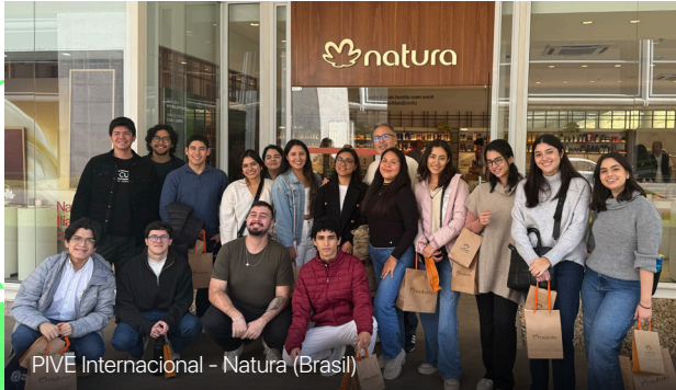
PIVE Internacional – Natura (Brasil)