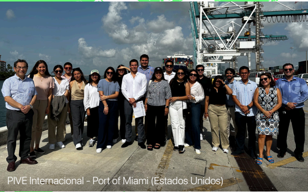
PIVE Internacional – Port of Miami (Estados Unidos)