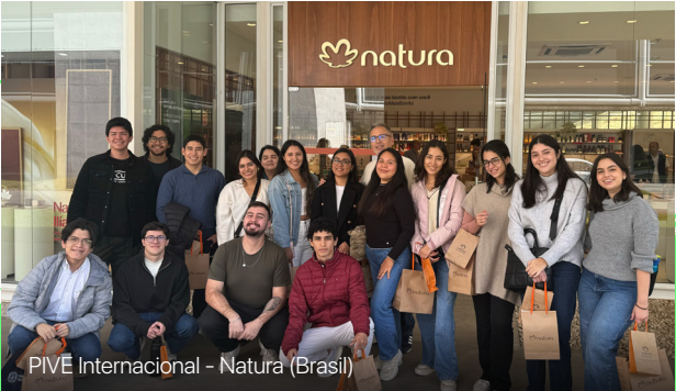
PIVE Internacional - Natura (Brasil)