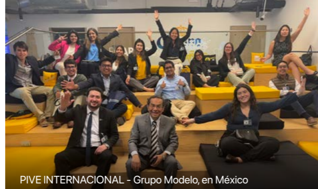
PIVE INTERNACIONAL - Grupo Modelo, en México