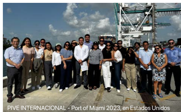
PIVE INTERNACIONAL - Port of Miami 2023, en Estados Unidos

En Negocios Internacionales de la UP te ofrecemos experiencias internacionales desde el primer año.