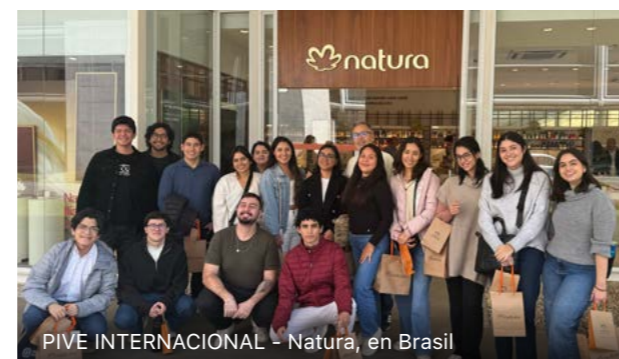
PIVE INTERNACIONAL - Natura, en Brasil