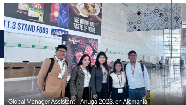
Global Manager Assistant - Anuga 2023, en Alemania