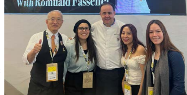
Global Manager Assistant - SIAL 2024, en Francia