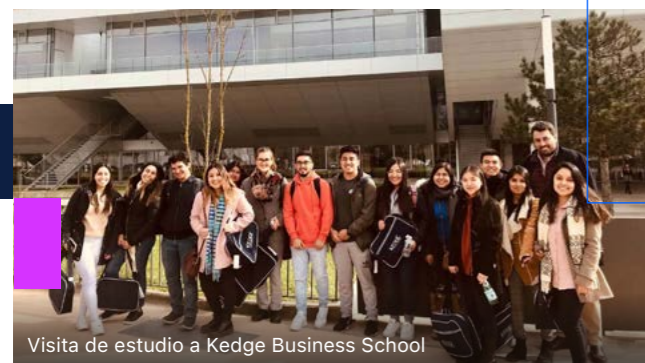
Visita de estudio a Kedge Business School