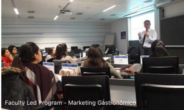
Faculty Led Program - Marketing Gastronómico