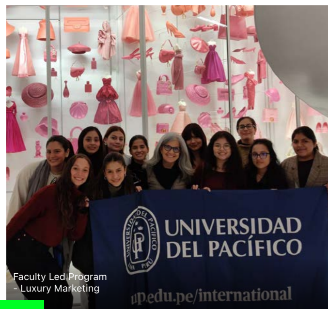
Faculty Led Program - Luxury Marketing

En Marketing de la UP te ofrecemos experiencias internacionales desde el primer ciclo.