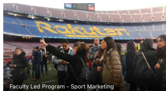
Faculty Led Program - Sport Marketing