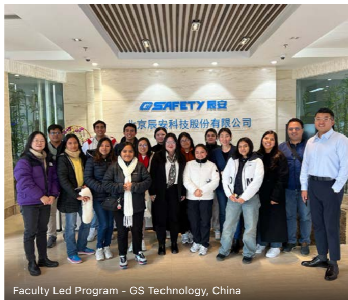
Faculty Led Program - GS Technology, China

En Ingeniería Empresarial de la UP te ofrecemos experiencias internacionales durante toda tu carrera.