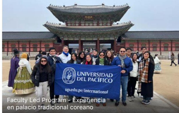
Faculty Led Program - Experiencia en palacio tradicional coreano