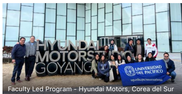
Faculty Led Program - Hyundai Motors, Corea del Sur