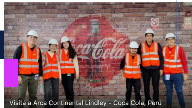
Visita a Arca Continental Lindley - Coca Cola, Perú