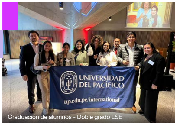
Graduación de alumnos - Doble grado LSE

En Administración de la UP te ofrecemos experiencias internacionales desde el primer ciclo.