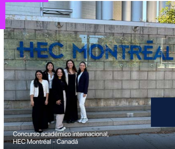
Concurso académico internacional, HEC Montréal - Canadá

En Administración de la UP te ofrecemos experiencias internacionales desde el primer ciclo.