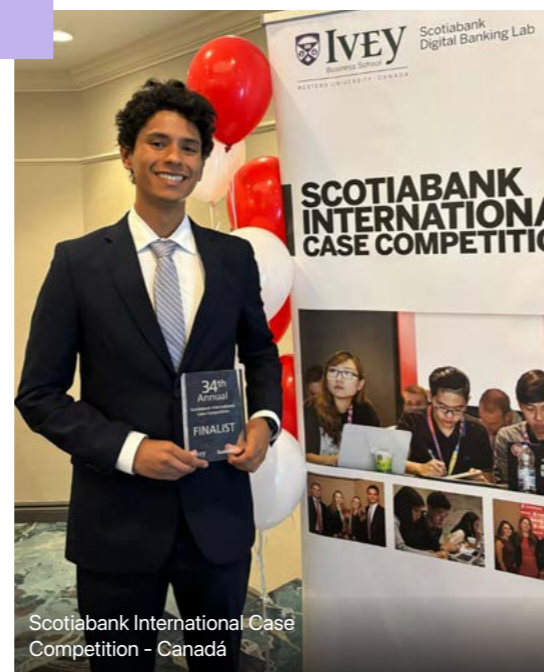
Scotiabank International Case Competition - Canadá