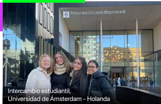
Intercambio estudiantil, Universidad de Ámsterdam - Holanda

+150 convenios internacionales con universidades top